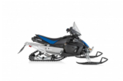
Viking 700 + $0.00