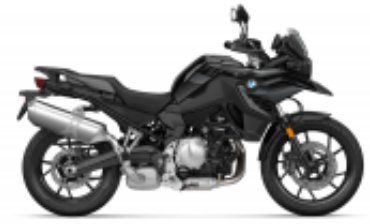
F 750 GS + $0.00