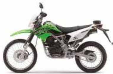
KLX 150 + $0.00