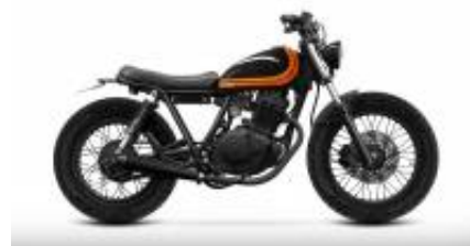
SR125 Caferacer + $0.00