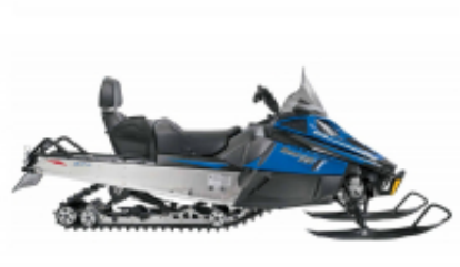
Bearcat XT + $0.00