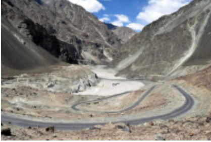
9 - Noubra - Bangong Co - 274 km