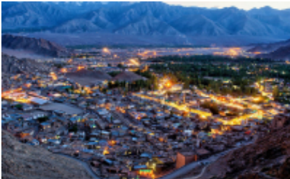
11 - Leh - Tsomoriri Lake View Point - 220 km