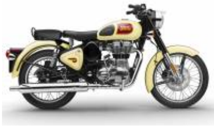
Classic 500 + $54.18