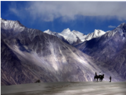
12 - Tsomoriri Lake View Point - Sarchu - 230 km