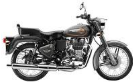
Bullet 500 + $54.18