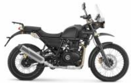
Himalayan 411 + $108.37