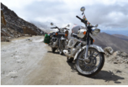
8 - Noubra - Noubra - 326 km