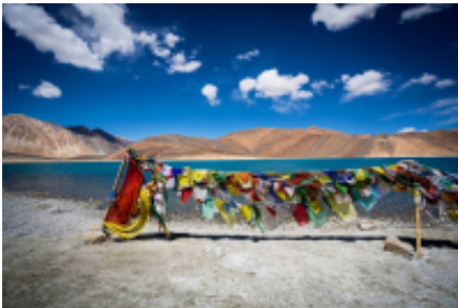
10 - Pangong - Leh - 225 km