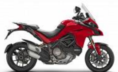
Multistrada 1260 + $520.92