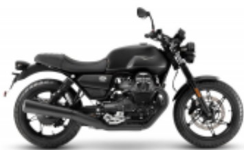
V7 Stone 800 + $0.00