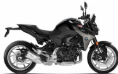
F 900 R + $0.00