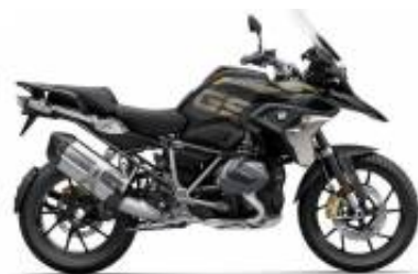
R 1250 GS LC + $520.92