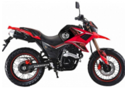
Fuego Tekken 250 + $0.00