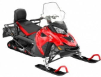
Lynx Adventure LX 600 ACE 2019 + 0,00 €