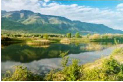
2 - Kerkini - Fort Rupel - 52