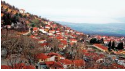
1 - GS Traveler Moto Rentals - Kerkini Lake National Park - 594