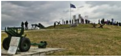
3 - Serrès - Alistratis Cave Jeskyne - 63