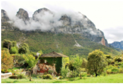
3 - Janina - Papingo -