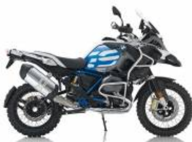
R 1200 GS Adv + $350.00