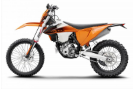
TPI/Six Days 300 + ¥0