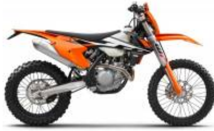
EXC 450 + ¥0