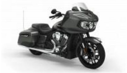
Challenger Street Touring Class + $390.00