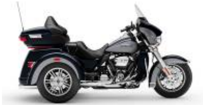
Trike Tri Glide (Gen) + $1,695.00