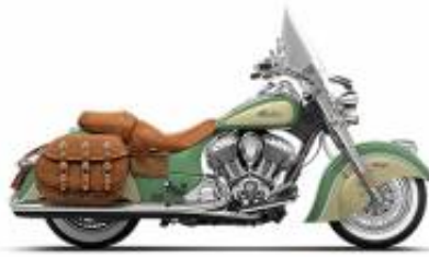
Chief Vintage + $390.00