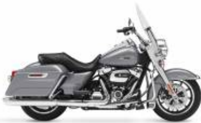
Road King (Gen) Cruiser Touring Class + $260.00