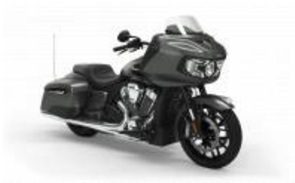
Challenger Street Touring Class + $390.00