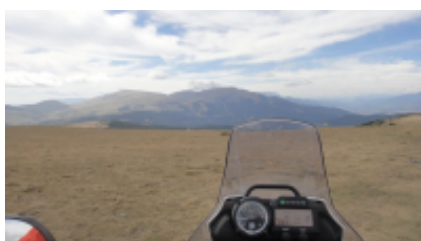
6 - Calle Azpilicueta - Hondarribia - 205