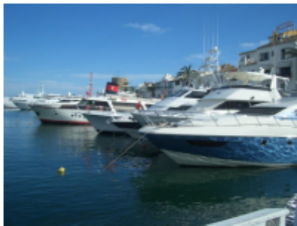
1 - Llançà - Llançà - 0