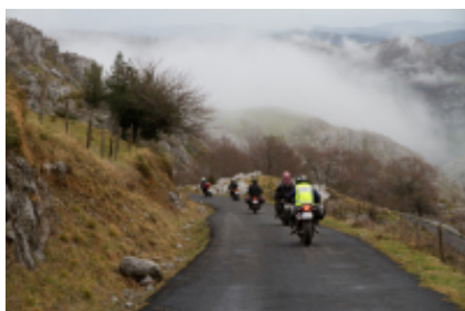
2 - Llançà - Fonda Rigà - 180