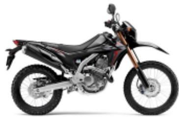
CRF 250 L + $701.21