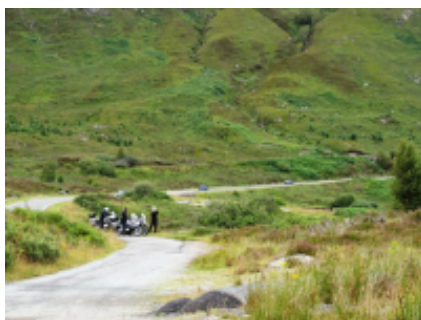
4 - Sort - Torla-Ordesa - 205