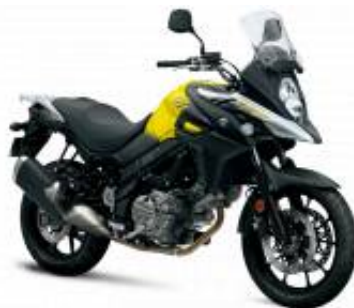
DL 650 V Strom + $0.00