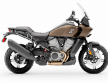
Pan America 1250 + $0.00