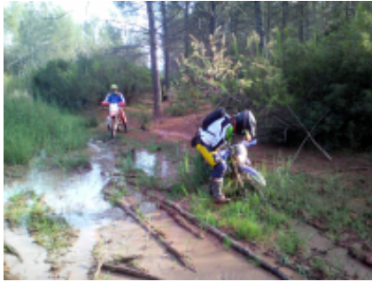
2 - Calp - Requena - 254