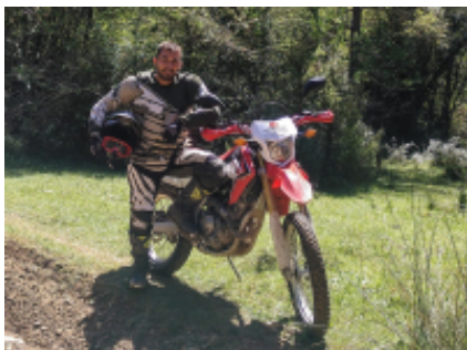
9 - Eidián - Finisterre - 167