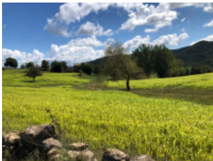
5 - Villoslada de Cameros - Aguilar de Campoo - 279