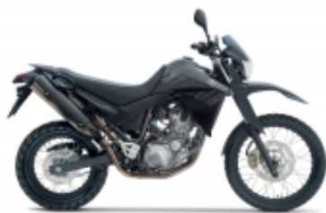
XT 660 R + $949.77