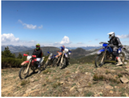
1 - Calp - Calp - 0