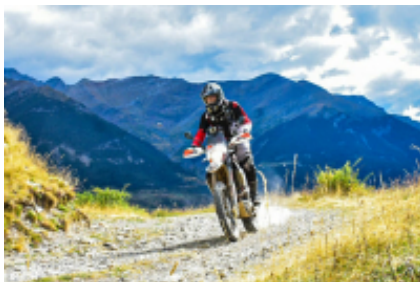
4 - Gallocanta - Villoslada de Cameros - 274