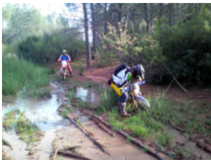
7 - Lugueros - Cangas del Narcea - 266