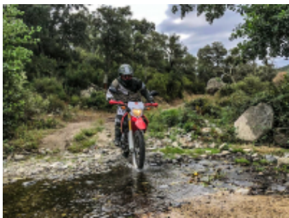
10 - Finisterre - Finisterre - 0