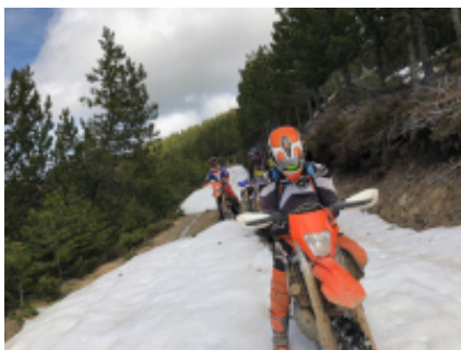
8 - Cangas del Narcea - Eidián - 239