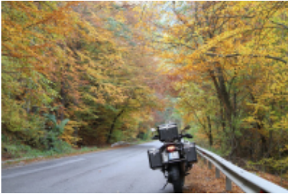
2 - Sofia - Veliko Tarnovo - 310