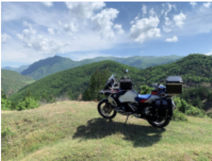
4 - Velingrad - Sofia - 400