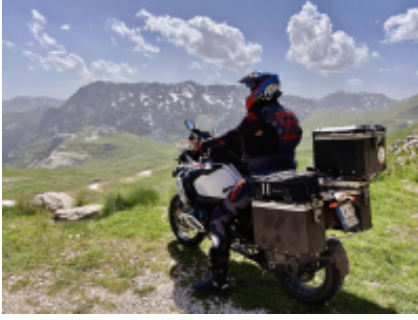
1 - Sofia - Sofia - 0