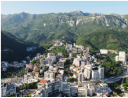
3 - Veliko Tarnovo - Velingrad - 340