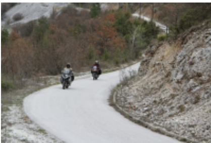
5 - Sofia - Sofia - 0