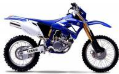
WR 450 + $0.00