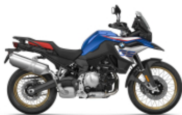
F 850 GS + $2,019.67