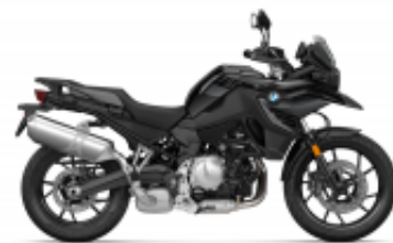
F 750 GS + $2,197.57