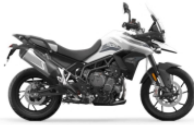
Tiger 900 GT + $0.00