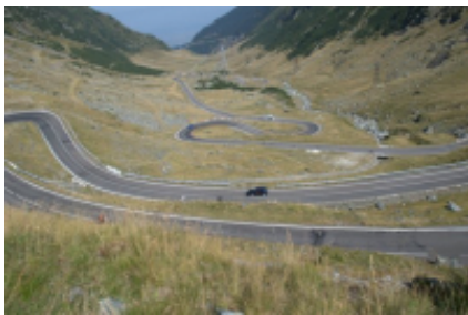
4 - Brașov - Brașov - 220 km