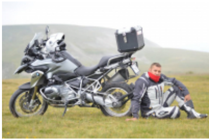
3 - Sighișoara - Brașov - 195 km