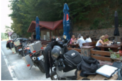
2 - Turda - Sighișoara - 210 km