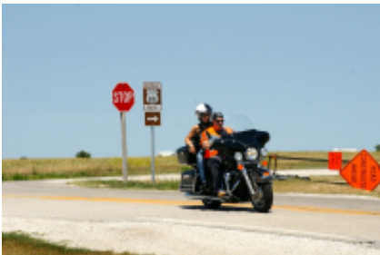
10 - Denver - - 0 km