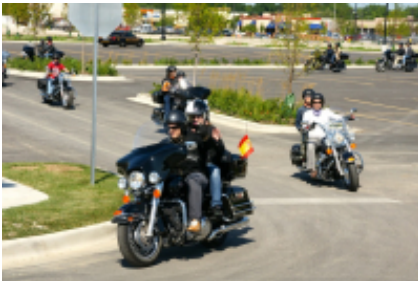
9 - Cheyenne - Denver - 236 km