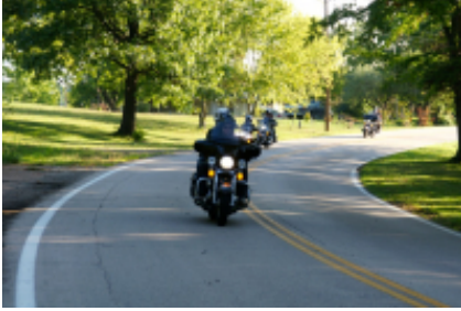
8 - Rapid City - Cheyenne - 436 km