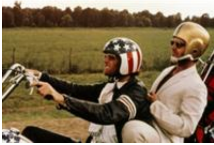
1 - - Denver - 0 km