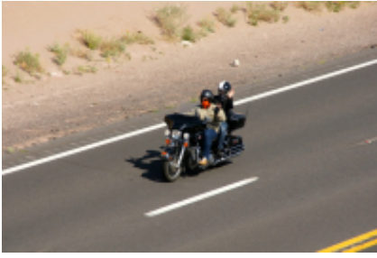
7 - Sturgis - Sturgis - 0 km