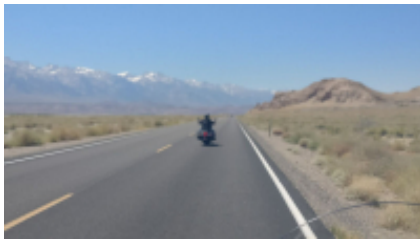
2 - Denver - Casper - 444 km