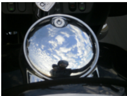
5 - Sturgis - Sturgis - 0 km