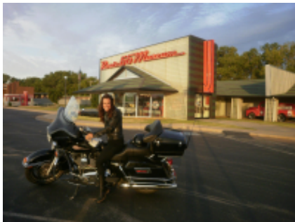
4 - Rapid City - Sturgis - 0 km