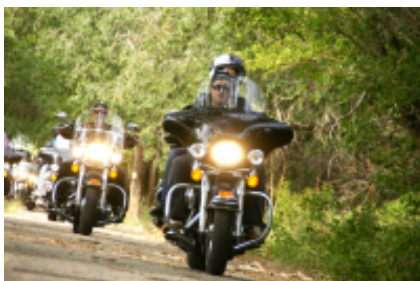
6 - Sturgis - Sturgis - 0 km