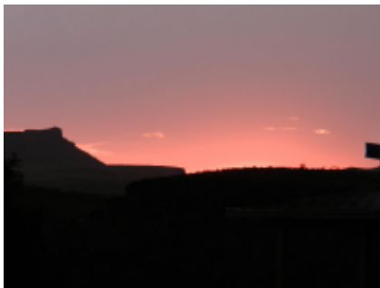
3 - Casper - Rapid City - 404 km