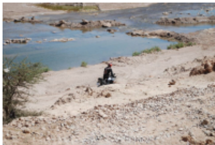
1 - - Algeciras -