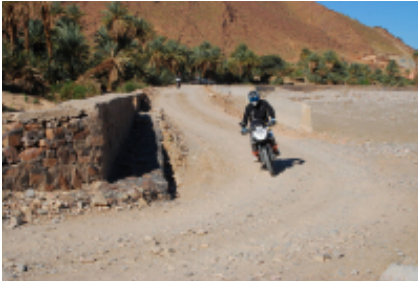
8 - Fes - Fes - 270 KM