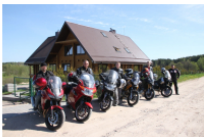
4 - Kaunas - Nida - 320 km