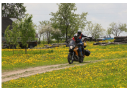
3 - Kaunas - Kaunas - 320 km