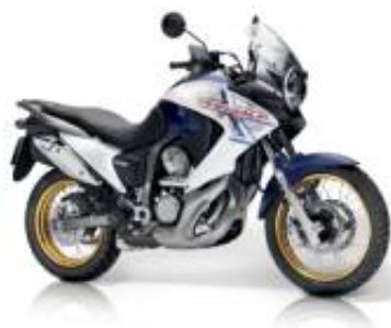
XL Transalp 700 + $0.00