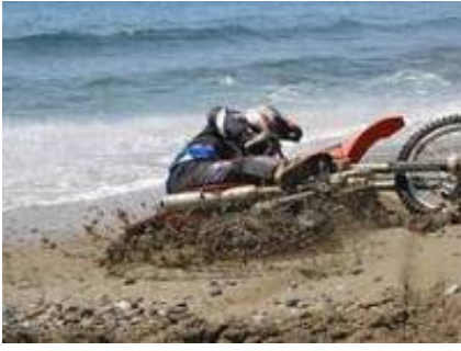
8 - Fatih - -