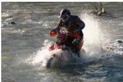
5 - Karapınar - Güzelyurt -