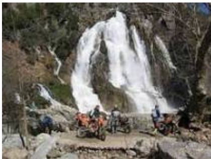
4 - Distretto di Taşkent - Karapınar -