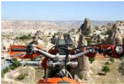
3 - Akseki - Distretto di Taşkent -