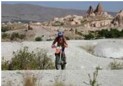
2 - Adalia - Akseki -