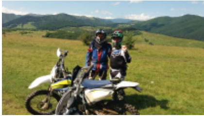
2 - Sibiu - Măgura - 6h