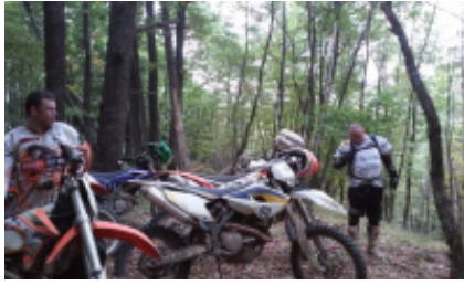
1 - - Sibiu -