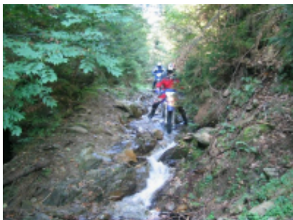
5 - Sibiu - Lacul Negovanu -