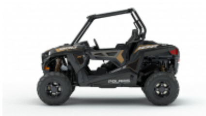
RZR 900 + $0.00