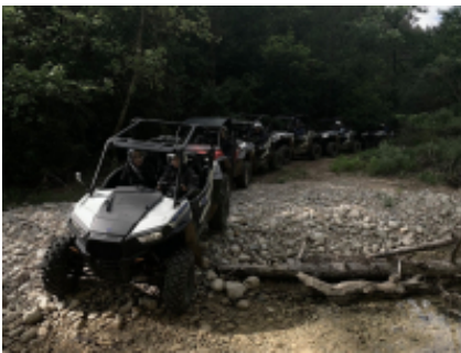
4 - Al-Rashidiyya - Al-Rashidiyya -