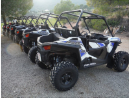
2 - Al-Rashidiyya - Al-Rashidiyya -