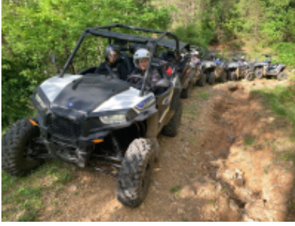
1 - Al-Rashidiyya - Al-Rashidiyya -