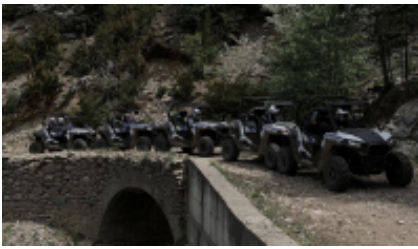
3 - Al-Rashidiyya - Al-Rashidiyya -