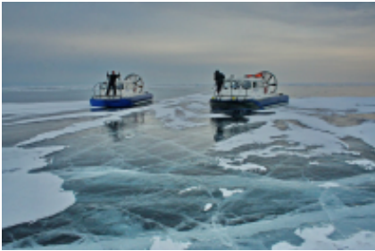
2 - Listvjanka - Listvjanka -