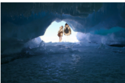
5 - Irkutsk - Irkutsk -