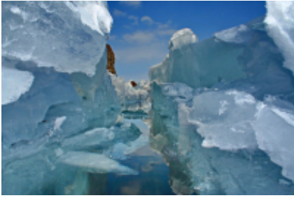
1 - Irkutsk - Listvjanka -