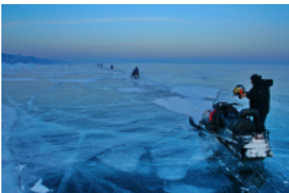
4 - Irkutsk - Irkutsk -