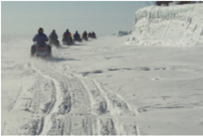
3 - Vydrino - Bolshiye Koty -