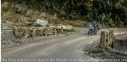
The Best Adventures Start In the Middle of the World - EcuadorFreedom.com