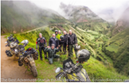
The Best Adventures Start In the Middle of the World - EcuadorFreedom.com