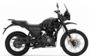
Himalayan 400 + $510.00