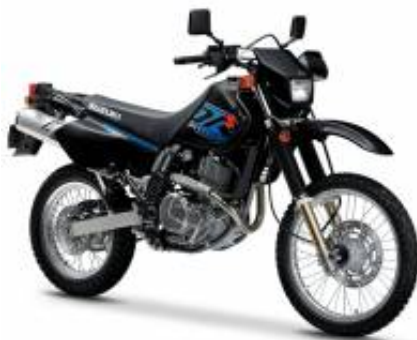
DR 650 + $678.00