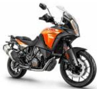
1290 Adventure S + $0.00