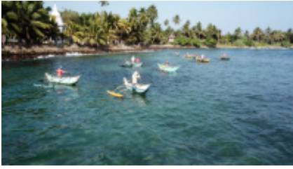
8 - Roccia del leone - - 170