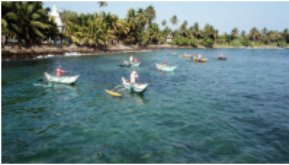
2 - Colombo - Distretto di Anuradhapura - 175