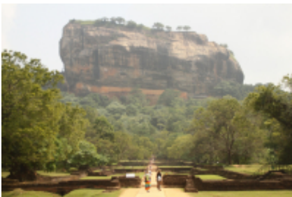
3 - Distretto di Anuradhapura - Jaffna - 225