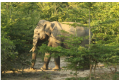
6 - Trincomalee - Roccia del leone - 170