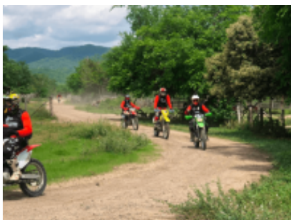
5 - Villeta - Honda -