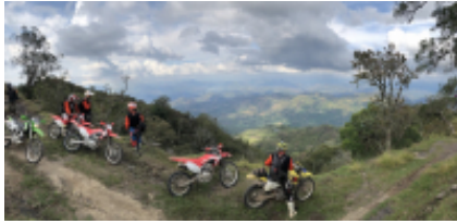
2 - Villa de Leyva - Ubaté -