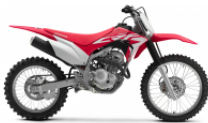
CRF 250 F + $0.00