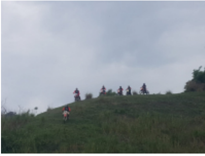
8 - Hotel Termales Del Ruiz - Salento -