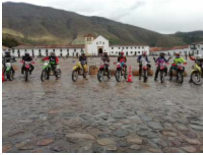
1 - Bogotá - Villa de Leyva -