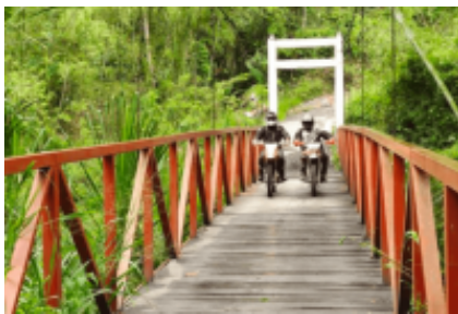
4 - Pacho - Villeta -