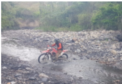
3 - Ubaté - Pacho -