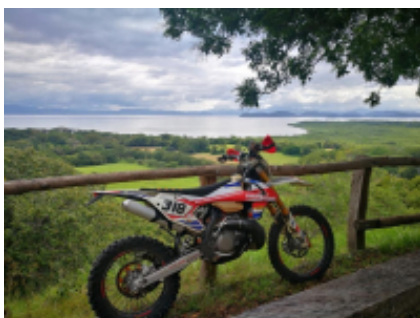
6 - Honda - Honda -