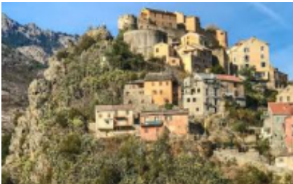
9 - Bastia - Corte -