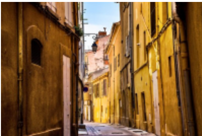
5 - Mouriès - Manosque -