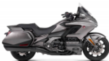
Goldwing DCT 2018 + $575.37