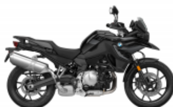
F 750 GS + $0.00