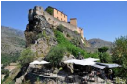
10 - Corte - Corte -