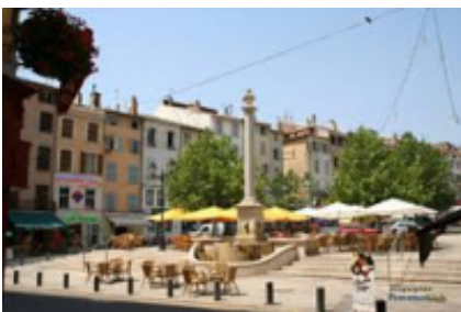
12 - Brianzoni - Draguignan -