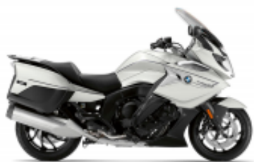
K 1600 GTL + $849.36