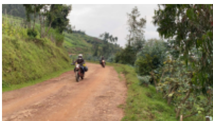
6 - foresta di Nyungwe - Provincia di Kigali - 115