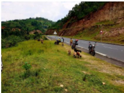
3 - Parco nazionale dei Vulcani - Gisenyi - 0