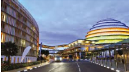
1 - Aeroporto di Kigali-Gregoire - Kinigi - 0