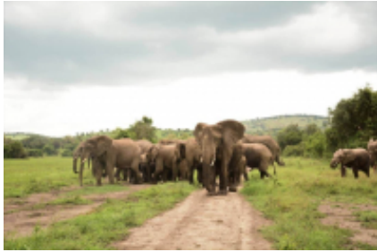
2 - Provincia di Kigali - Parco nazionale dei Vulcani - 110