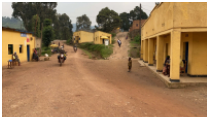
4 - Gisenyi - Kibuye - 80