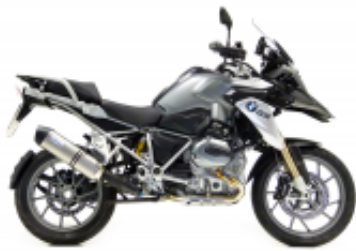
R 1200 GS LC + $630.38