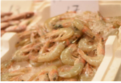
8 - Leucade - Giannina - 225