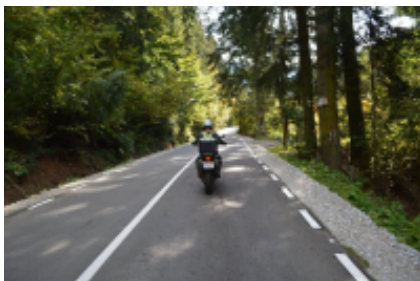
4 - Gura Humorului - Gura Humorului - 140