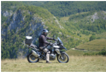
2 - Turda - Pasul Birgaului - 220