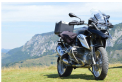
11 - Turda - Aeroporto di Cluj-Avram Iancu - 40