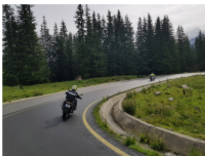
9 - Transfăgăraşan - Transalpina - 200