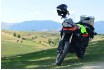
1 - Aeroporto di Cluj-Avram Iancu - Turda - 40