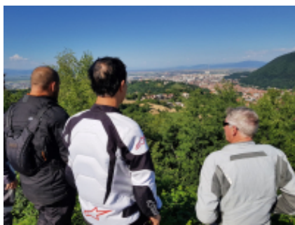
8 - Braşov - Transfăgăraşan - 218