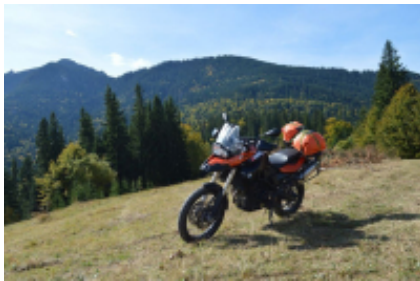
3 - Pasul Birgaului - Gura Humorului - 126