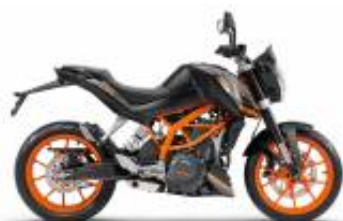
Duke 390 + $0.00