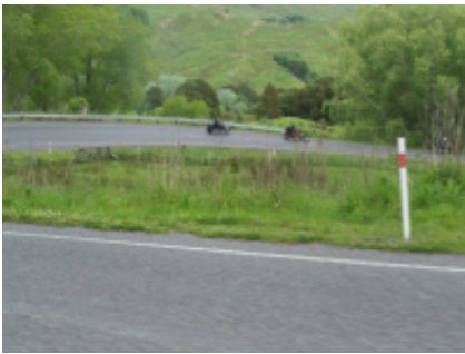
3 - Parco nazionale dei laghi Waterton - Creston - 269 km