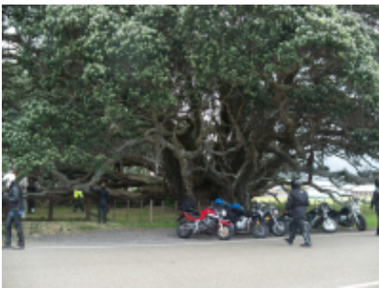
4 - Creston - Osoyoos - 383 km