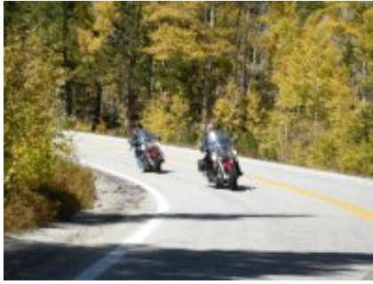
2 - Calgary - Parco nazionale dei laghi Waterton - 430 km