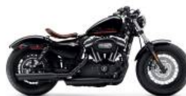
Sportster 1200 + $0.00