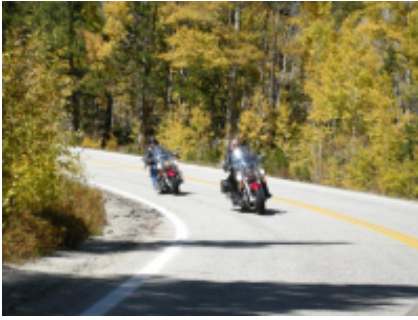
2 - Calgary - Parco nazionale dei laghi Waterton - 430 km