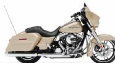
Street Glide Special + $850.00