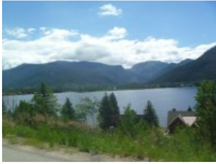
1 - Calgary - Calgary - 25 km