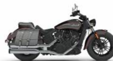
Scout Sixty + $850.00