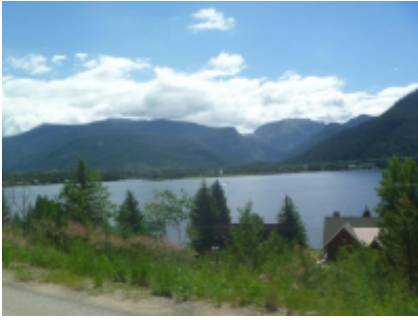
1 - Calgary - Calgary - 25 km