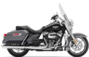
Road King Street Classic Class + $850.00