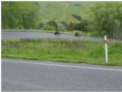
3 - Parco nazionale dei laghi Waterton - Creston - 269 km