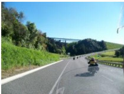
5 - Osoyoos - Vernon - 346 km