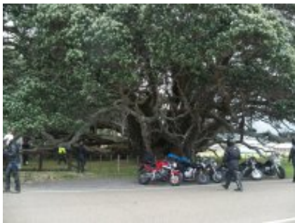
4 - Creston - Osoyoos - 383 km