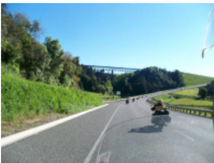
5 - Osoyoos - Vernon - 346 km