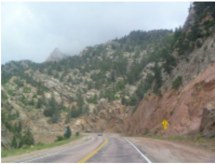
12 - Calgary - Calgary - 25 km