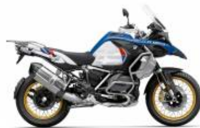
R 1250 GS Adv LC + $199.07