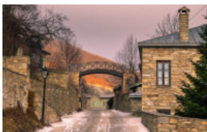
3 - Pozar Baths - Nymfaio - 85