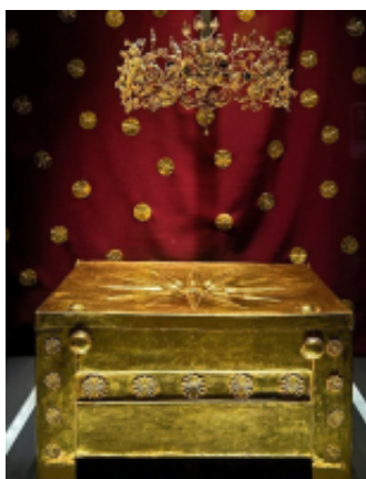
4 - Verghina - GS Traveler Moto Rentals - 84