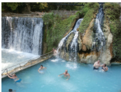
1 - GS Traveler Moto Rentals - Pozar Baths - 643