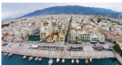
4 - Calamata - GS Traveler Moto Rentals - 240