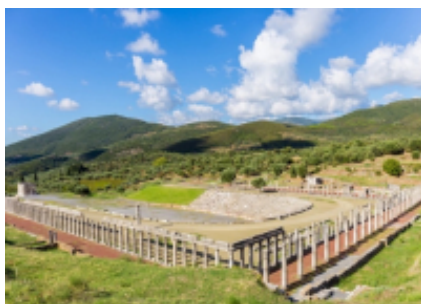
3 - Messene - Calamata - 37