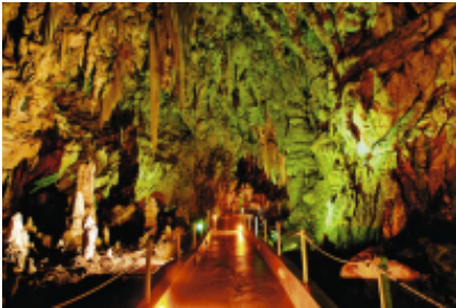
4 - Palaios Panteleimonas, Historical Mountain Village - GS Traveler Moto Rentals - 410