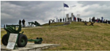
3 - Serres - Alistratis Cave Jeskyne - 63