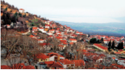
1 - GS Traveler Moto Rentals - Kerkini Lake National Park - 594