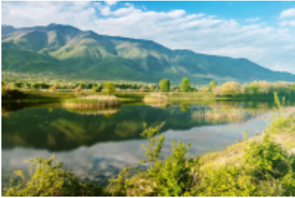
2 - Lake Kerkini - Fort Roupel - 52