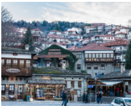
5 - Giannina - Metsovo -