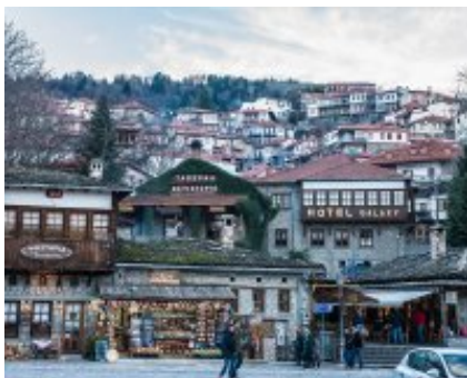
5 - Giannina - Metsovo -