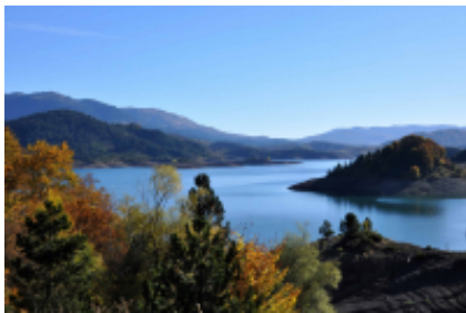
4 - Giannina - Pindos National Park -