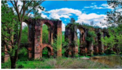
1 - GS Traveler Moto Rentals - Giannina -