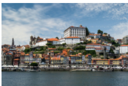
6 - Mira - Porto - 99