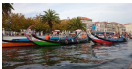
2 - Mira - Mira - 55