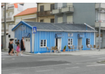
3 - Mira - Foz do Arelho - 260