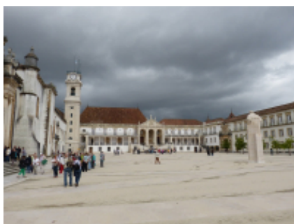
5 - Tomar - Mira - 166