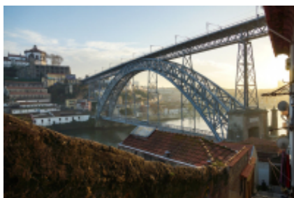
4 - Foz do Arelho - Tomar - 430