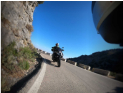
8 - Málaga - Málaga - 0