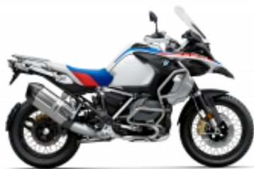
R 1250 GS Adventure + $164.39