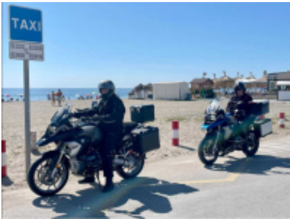
7 - Ronda - Málaga - 181