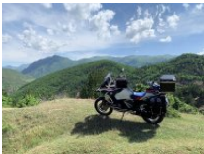
4 - Velingrad - Sofia - 400