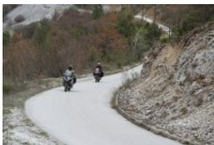
5 - Sofia - Sofia - 0