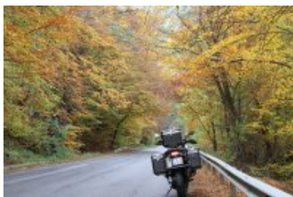
2 - Sofia - Veliko Tŕrnovo - 310