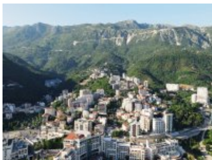
3 - Veliko Tŕrnovo - Velingrad - 340