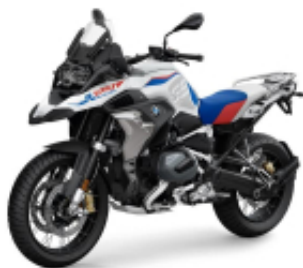
R 1250 GS Rally + $3,145.38